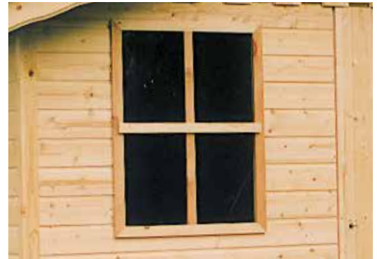
Vast raam 60x80cm Fenêtre fixe 60x80cm