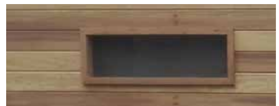
Vast raam 25x80cm of 25x100cm Fenêtre fixe 25x80cm ou 25x100cm