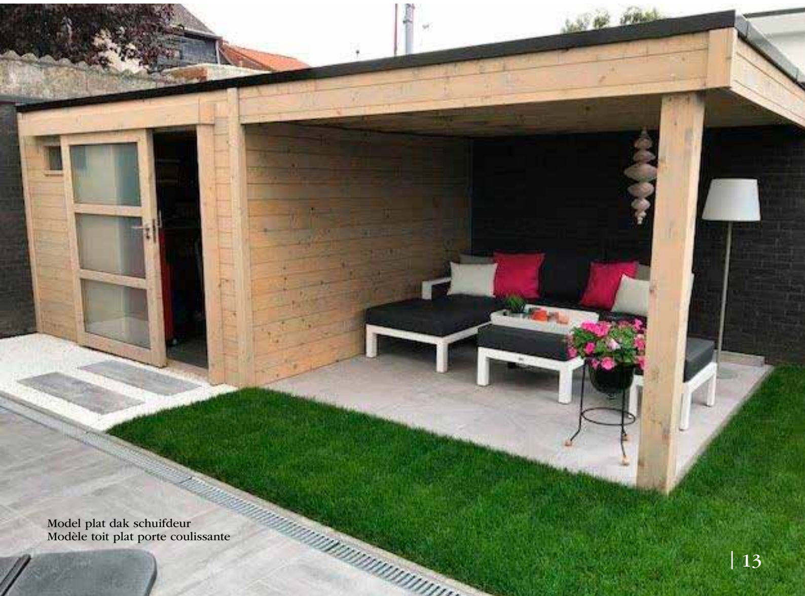
Model plat dak schuifdeur Modèle toit plat porte coulissante