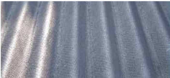
Golfplaten onduline / Plaques ondulées en onduline