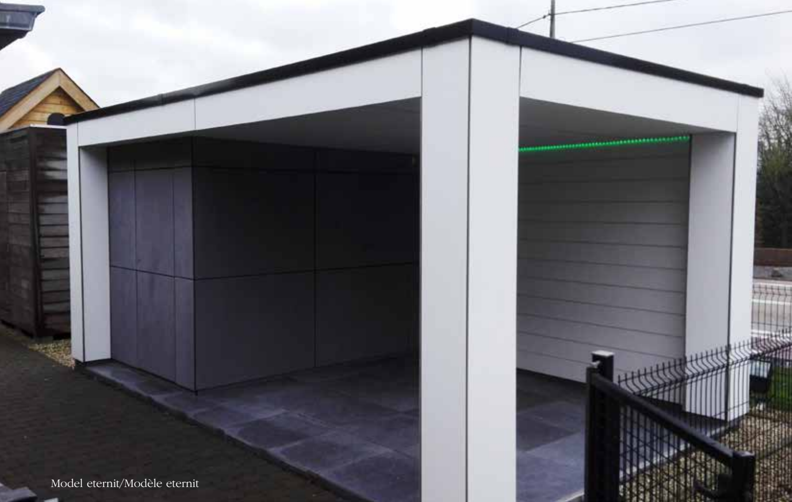
Model eternit/Modèle eternit