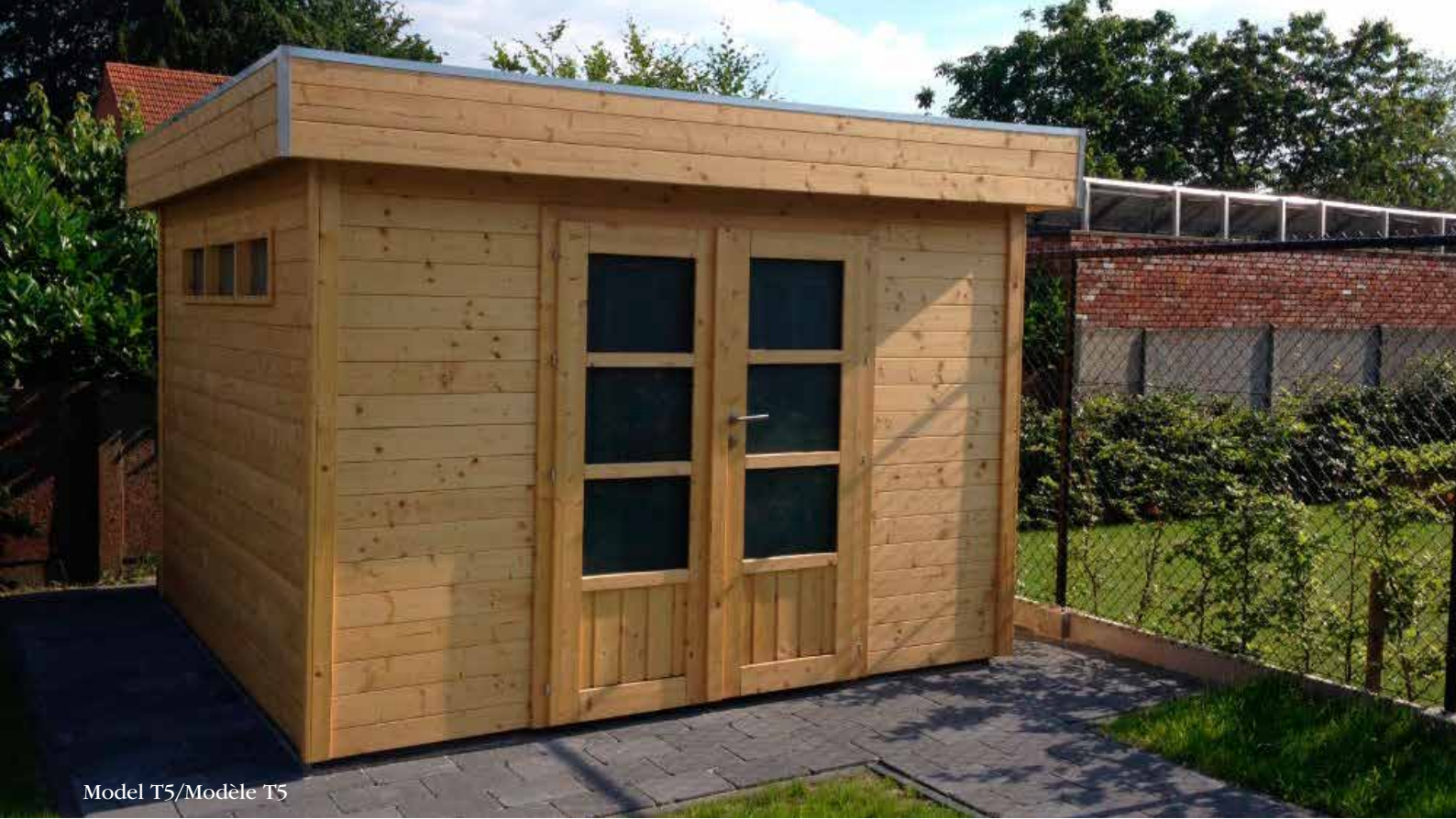
Model T5/Modèle T5