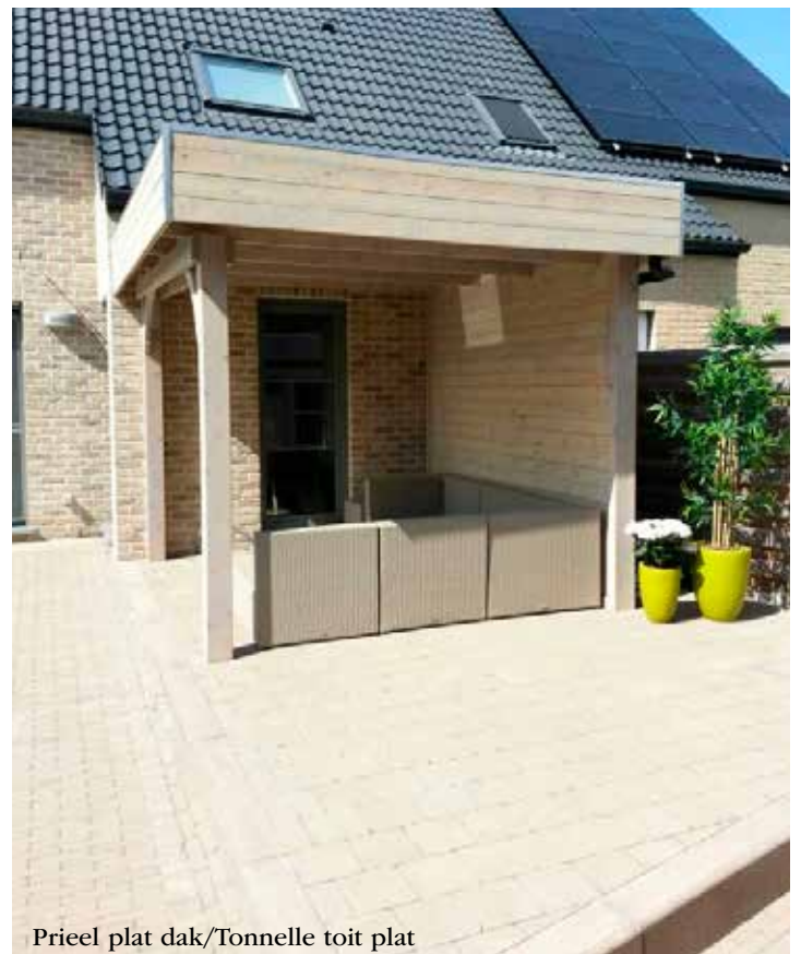
Prieel plat dak/Tonnelle toit plat