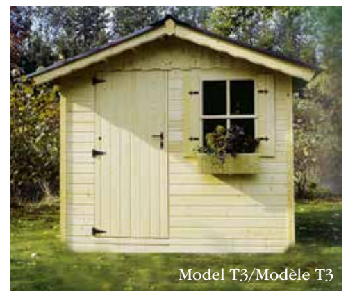
Model T3/Modèle T3