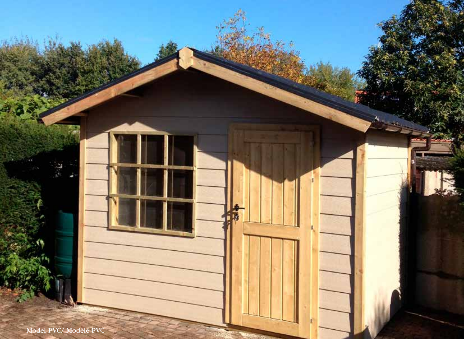
Model PVC/ Modèle PVC