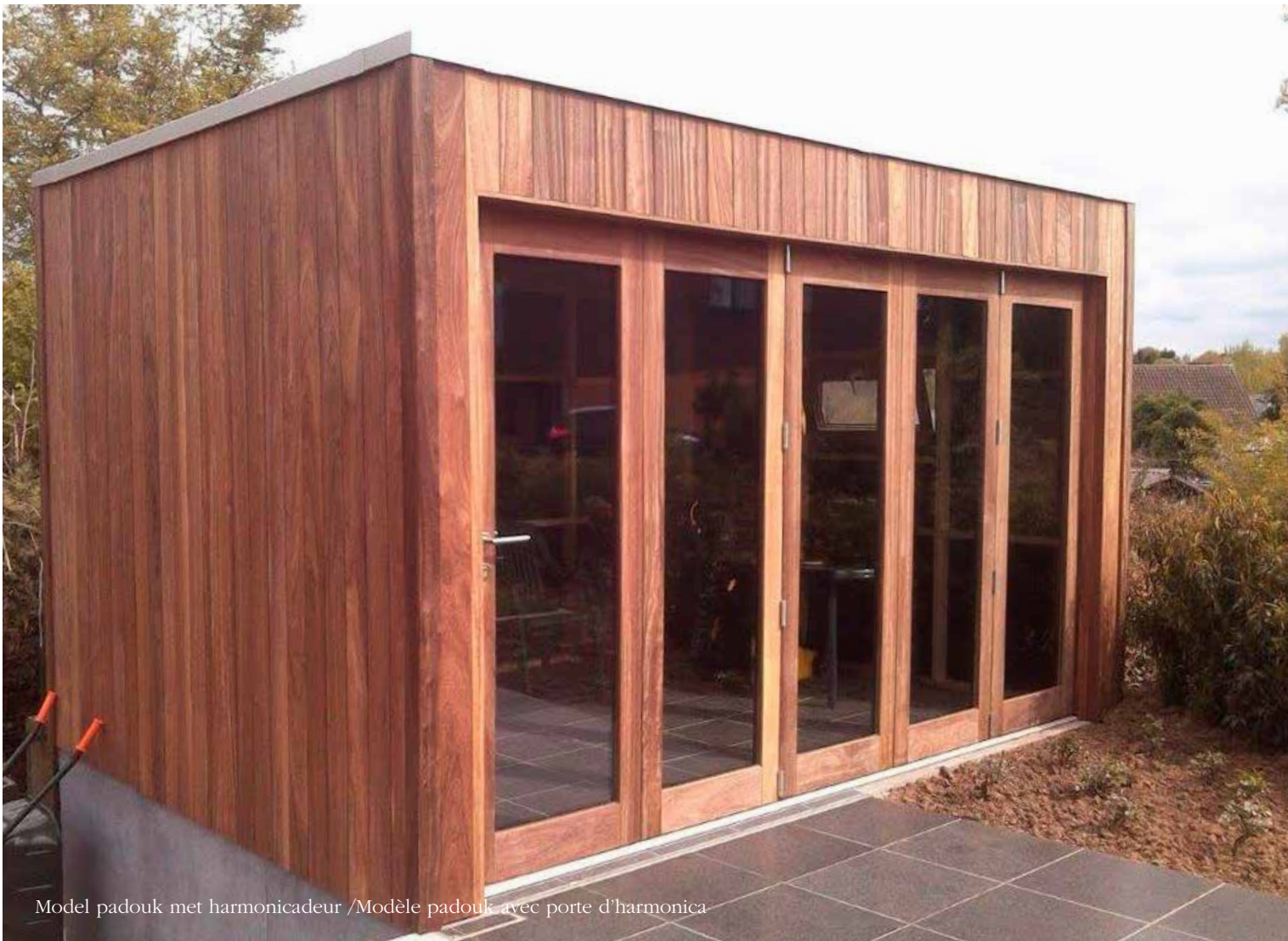
Model padouk met harmonicadeur /Modèle padouk avec porte d'harmonica