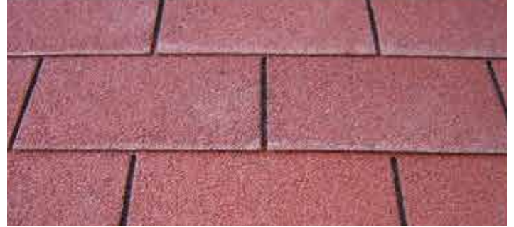
Shingels rood / Shingels rouge