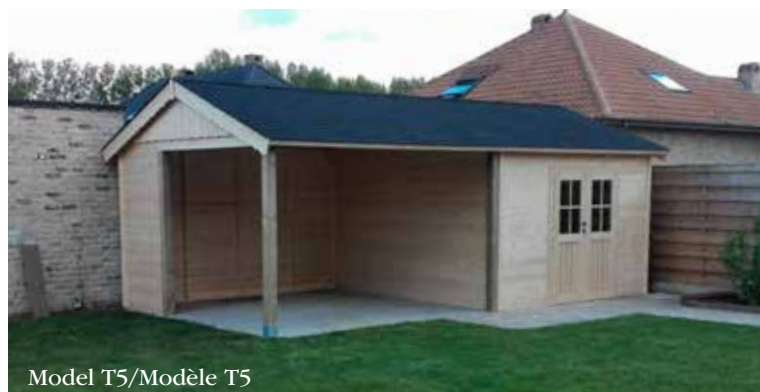
Model T5/Modèle T5