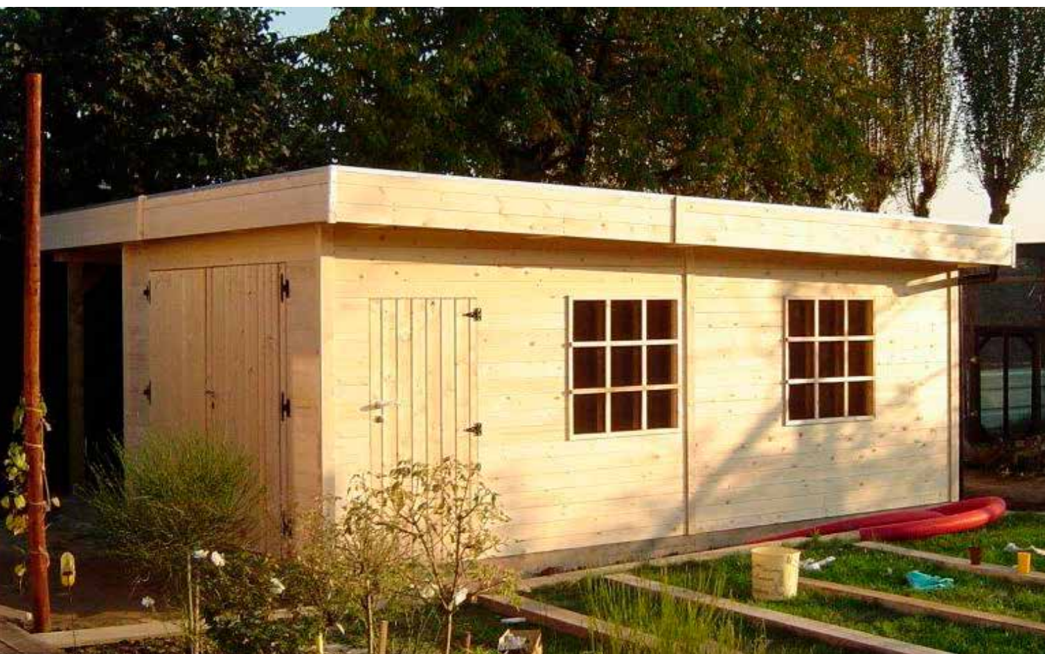
Garage plat dak/Garage toit plat