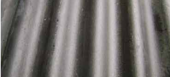
Golfplaten eternit / Plaques ondulées en éternit