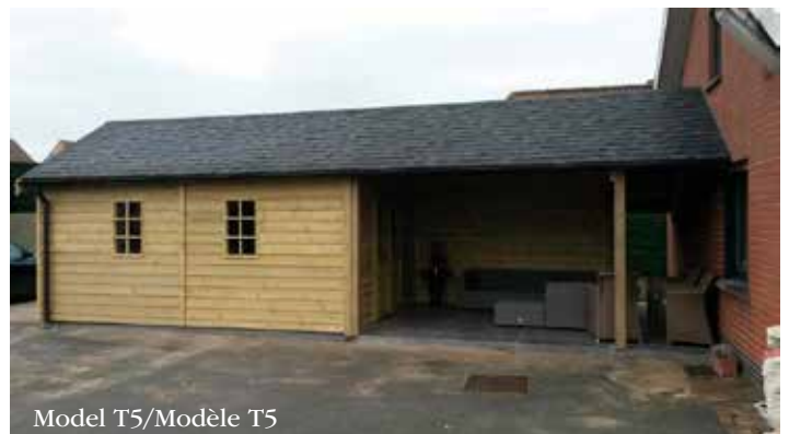
Model T5/Modèle T5