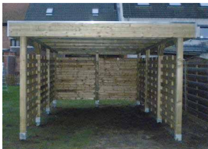
Carport zadeldak/Carport toit à deux pentes