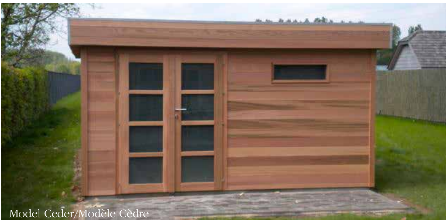
Model Ceder/Modèle Cèdre