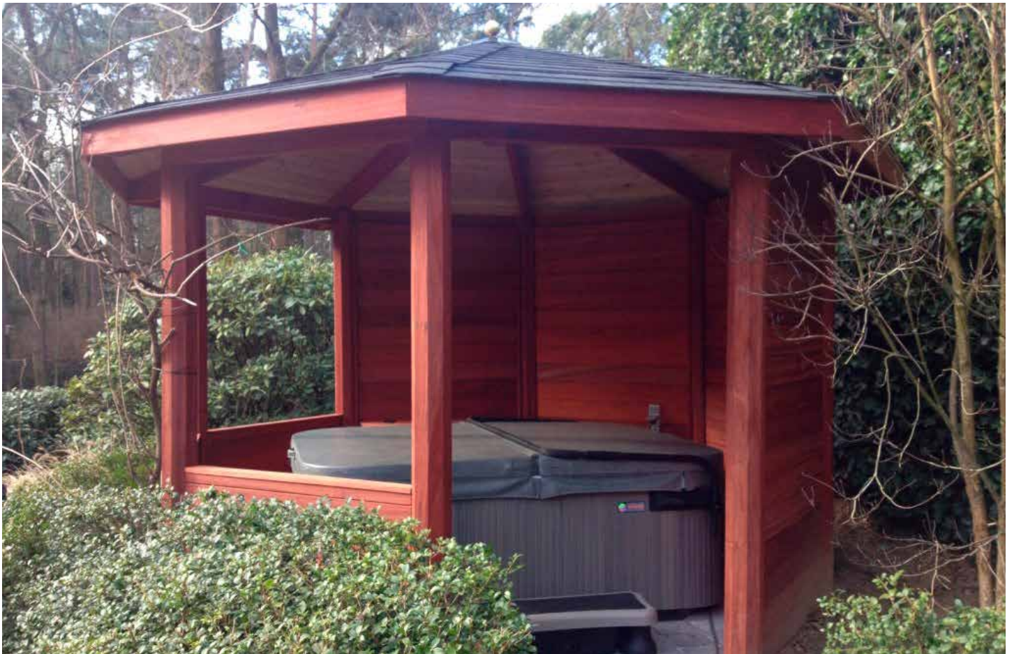
Model padouk/Modèle padouk