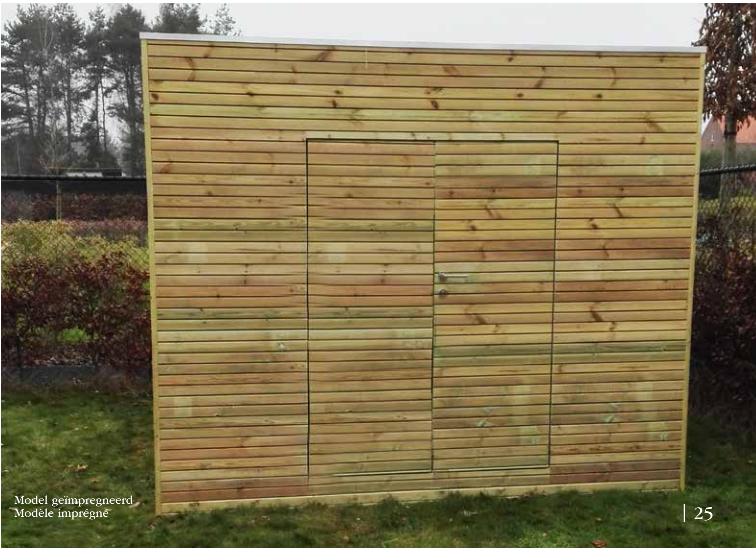
Model geïmpregneerd Modèle imprégné