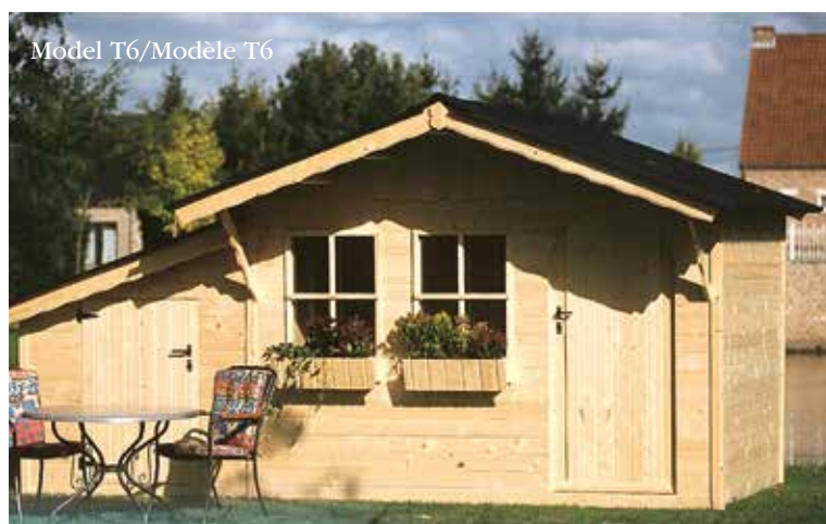
Model T6/Modèle T6