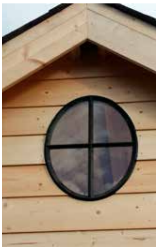
Ossenoog Oeil d'oxeye