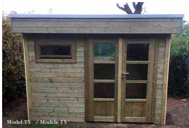
Model T5 / Modèle T5