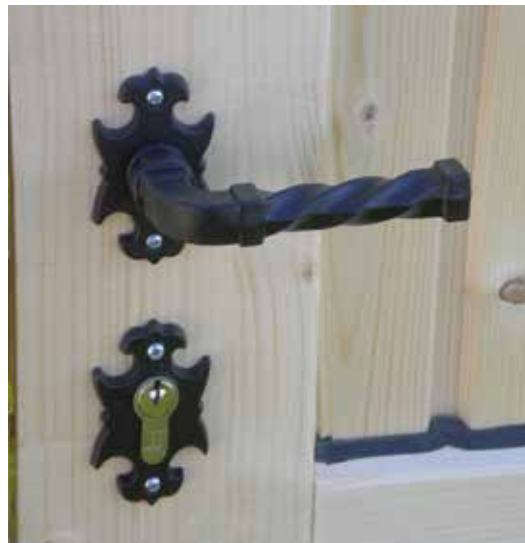
Klink rustiek Clenche rustique