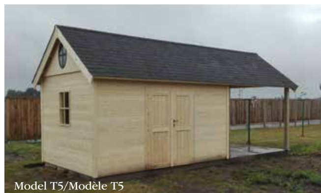
Model T5/Modèle T5