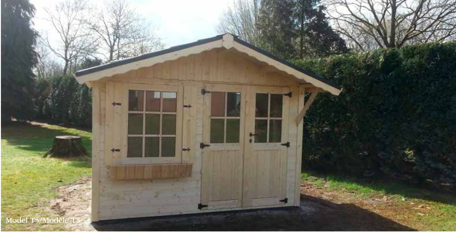
Model T5/Modèle T5