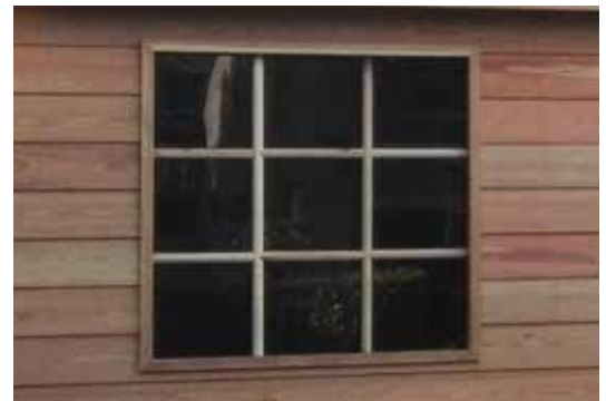
Vast raam 100x100cm Fenêtre fixe 100x100cm