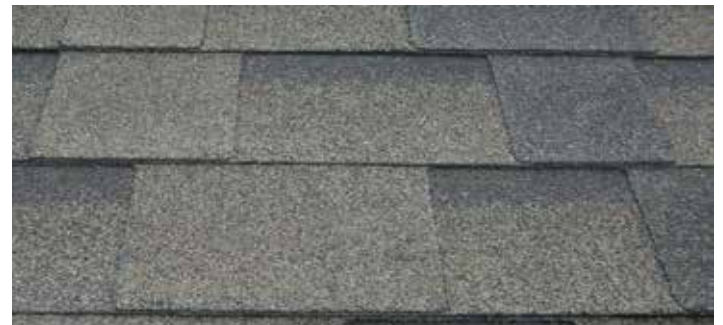
Cambridge bruin / Cambridge brun