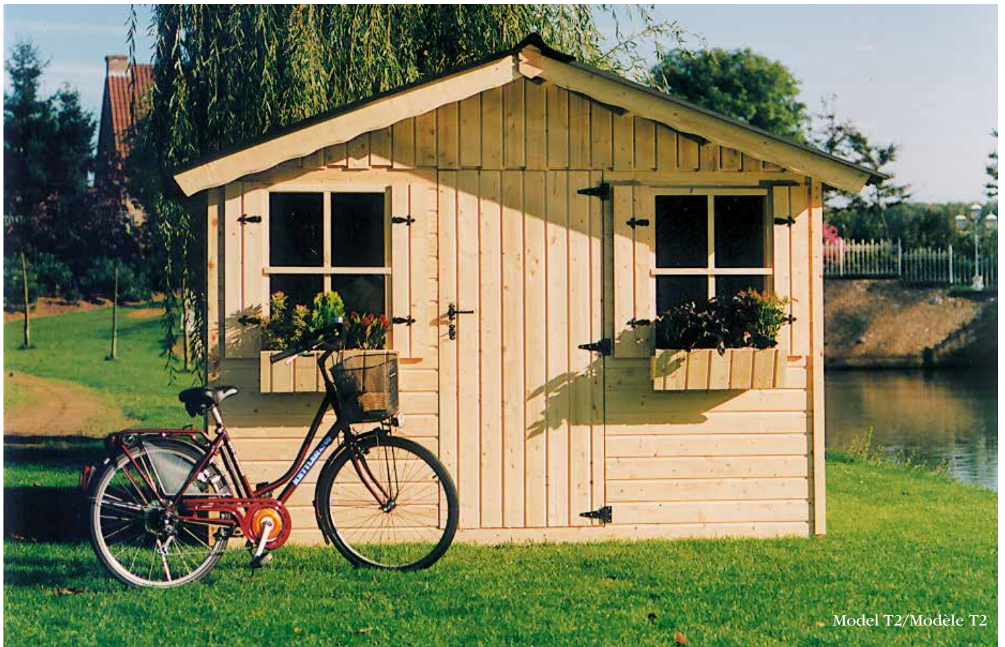
Model T2/Modèle T2