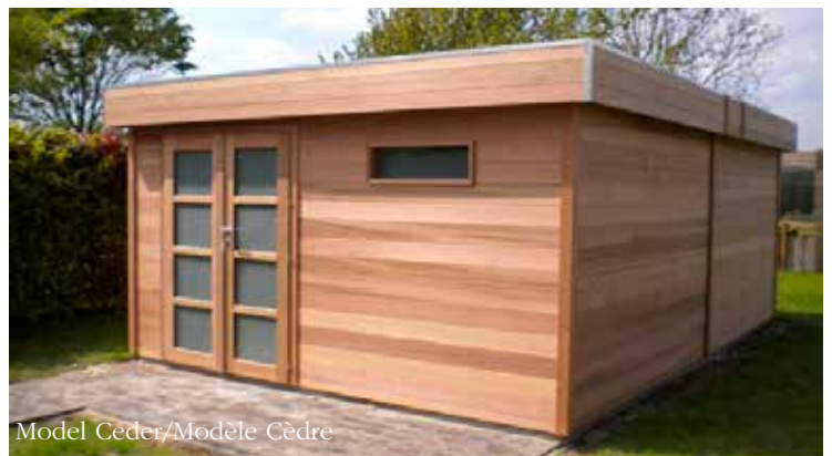
Model Ceder/Modèle Cèdre