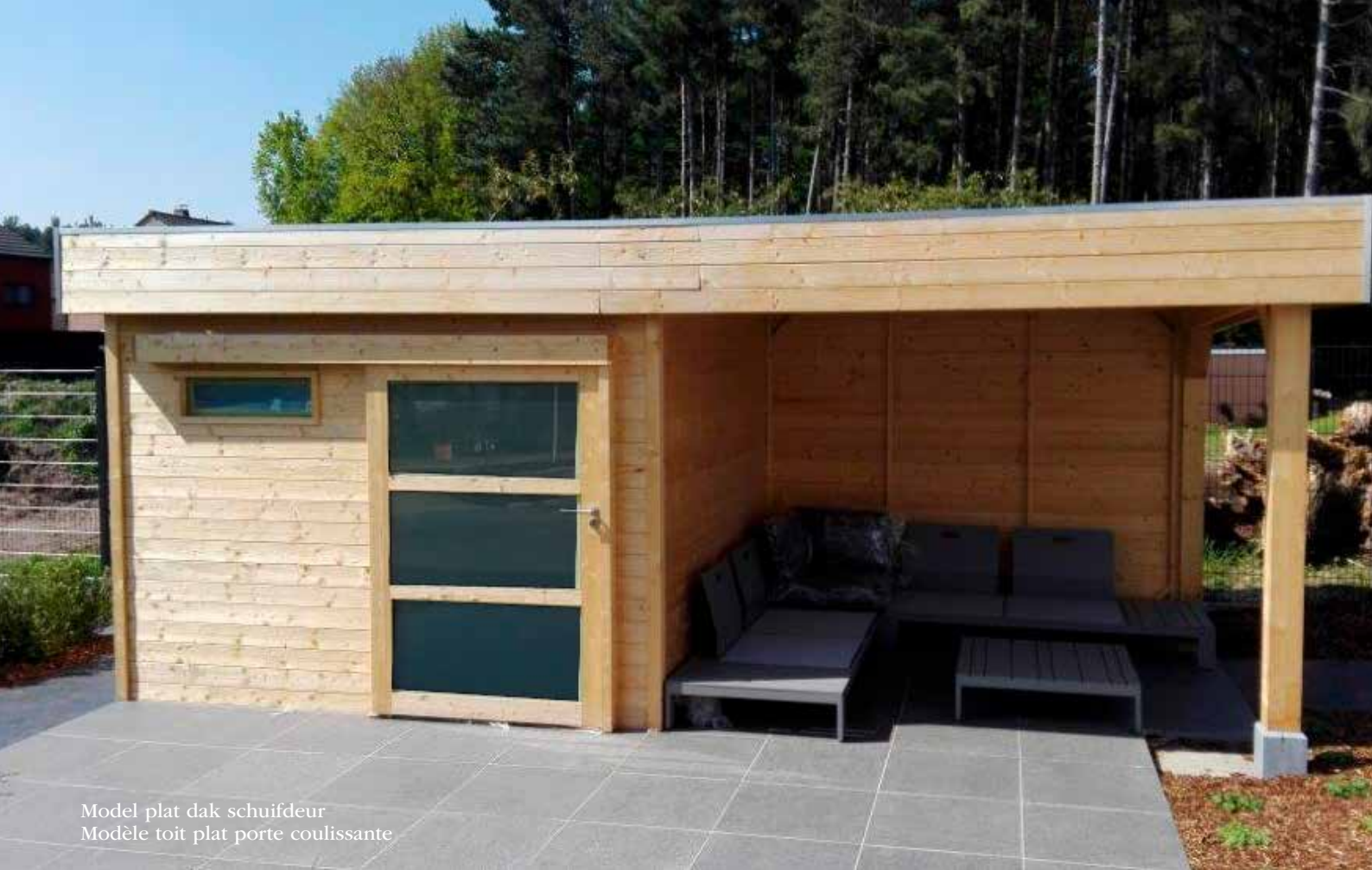
Model plat dak schuifdeur Modèle toit plat porte coulissante