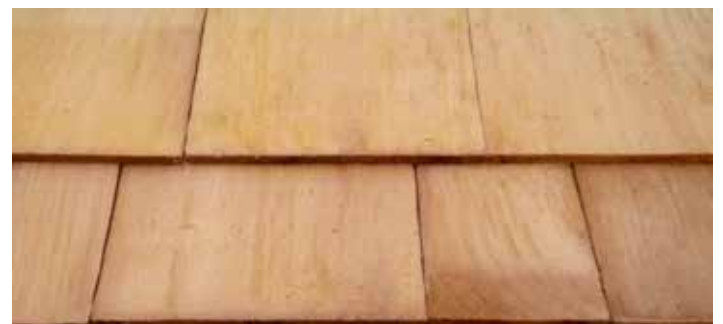
Shingels ceder / Shingels cèdre