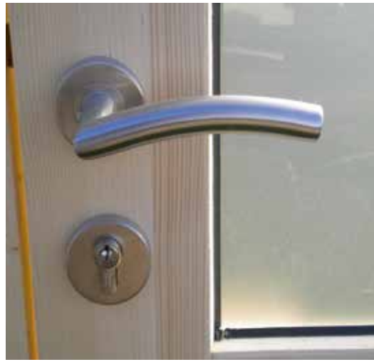
Deurklink moderne Clenche moderne