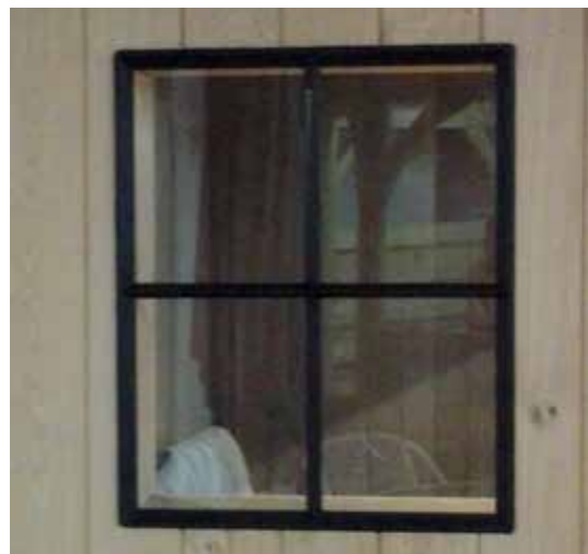
Smeedijzeren raam Fenêtre en fer forgé