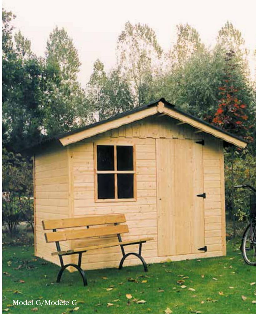
Model G/Modèle G