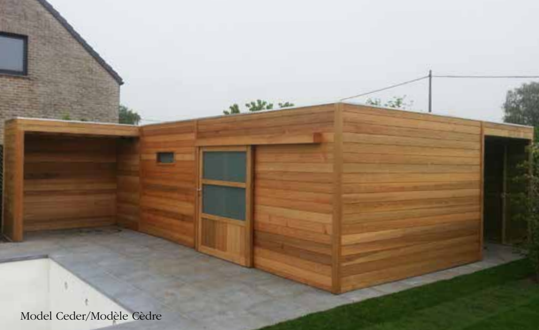
Model Ceder/Modèle Cèdre