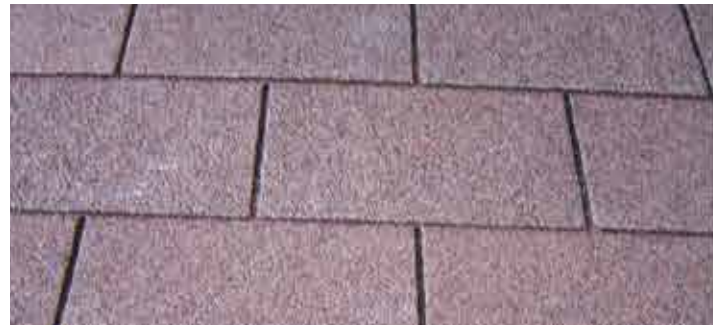
Shingels bruin / Shingels brun