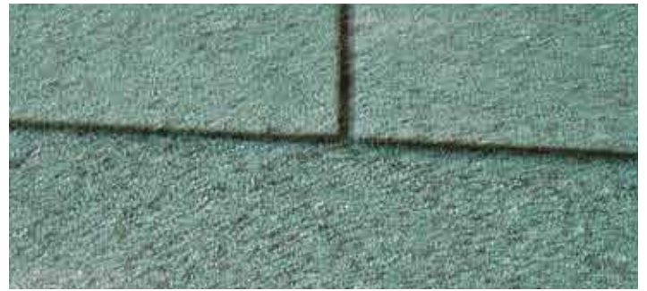
Shingels groen / Shingels vert