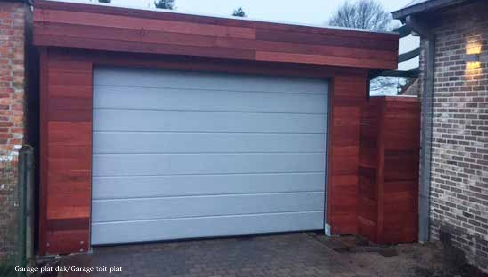
Garage plat dak/Garage toit plat