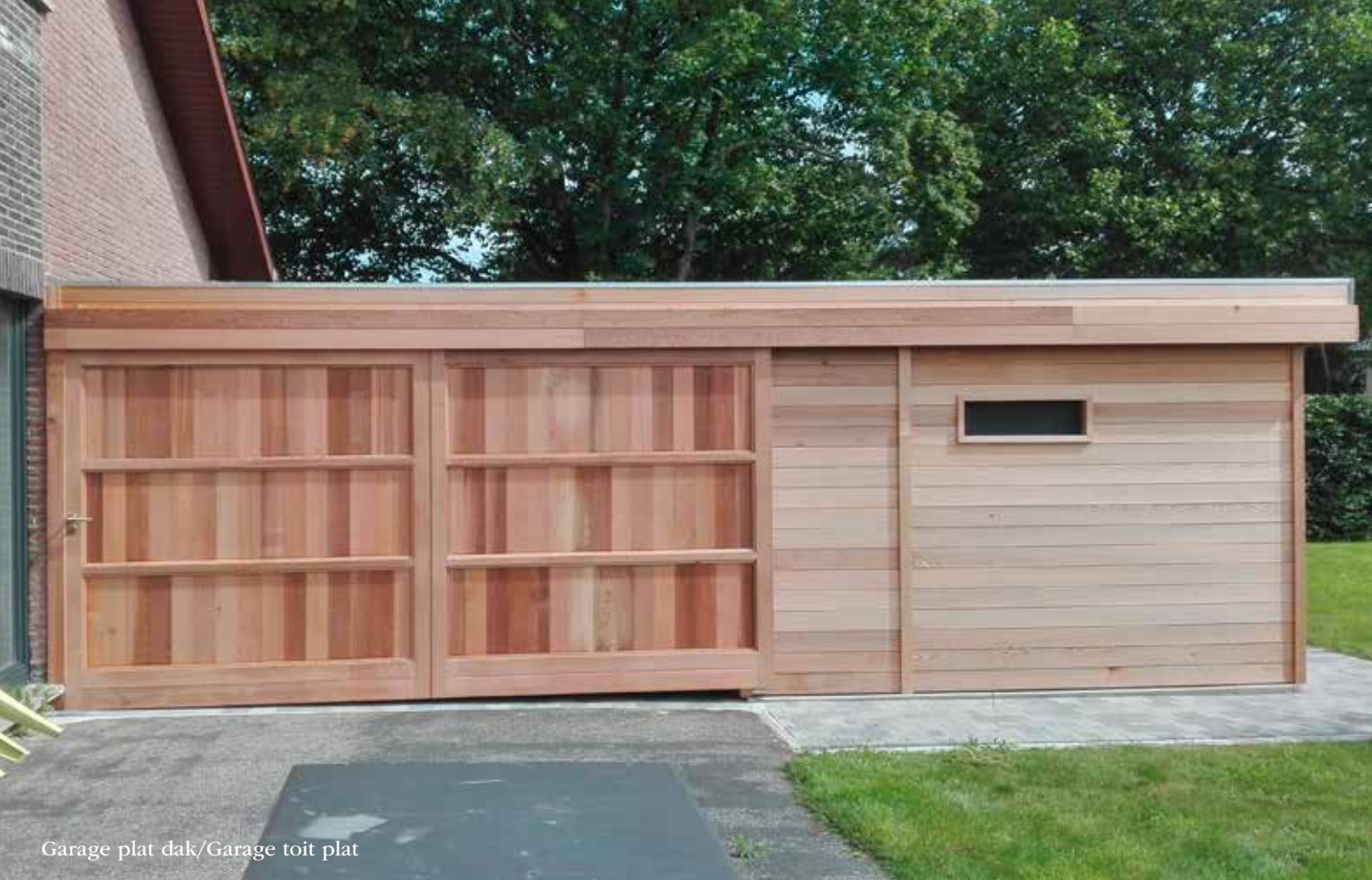
Garage plat dak/Garage toit plat