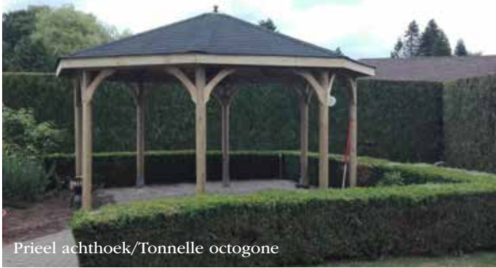
Prieel achthoek/Tonnelle octogone