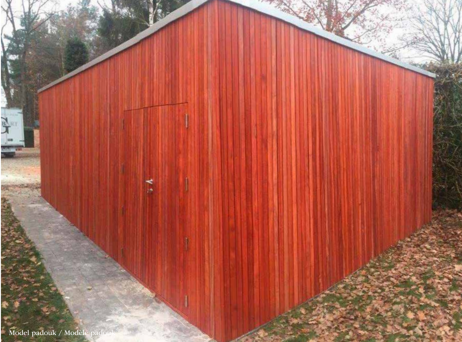
Model padouk / Modèle padouk