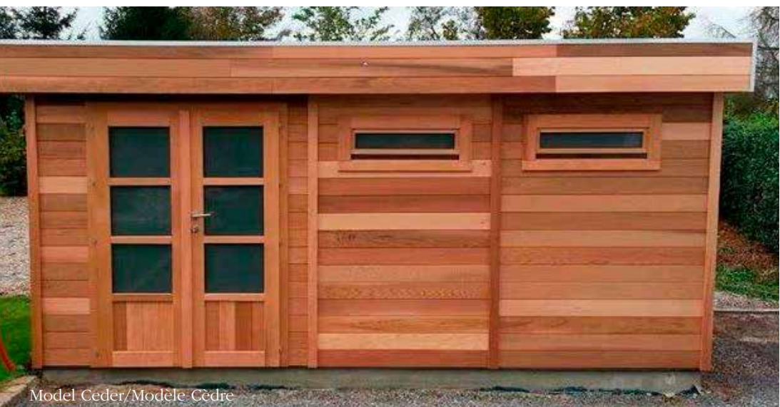
Model Ceder/Modèle Cèdre