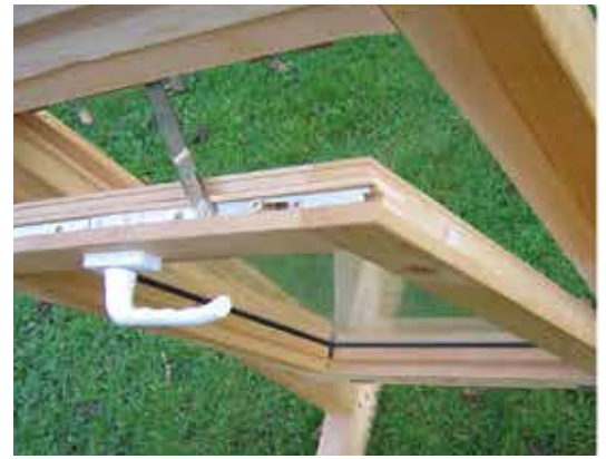
Draai Kipraam Fenêtre inclinable