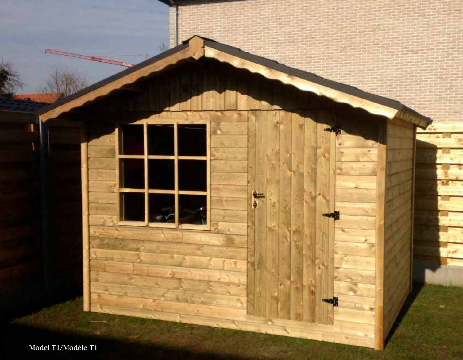
Model T1/Modèle T1