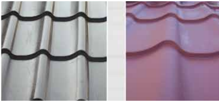
Dakpanplaat zwart en terracotta / Plaques de tuiles noires et terre cuite