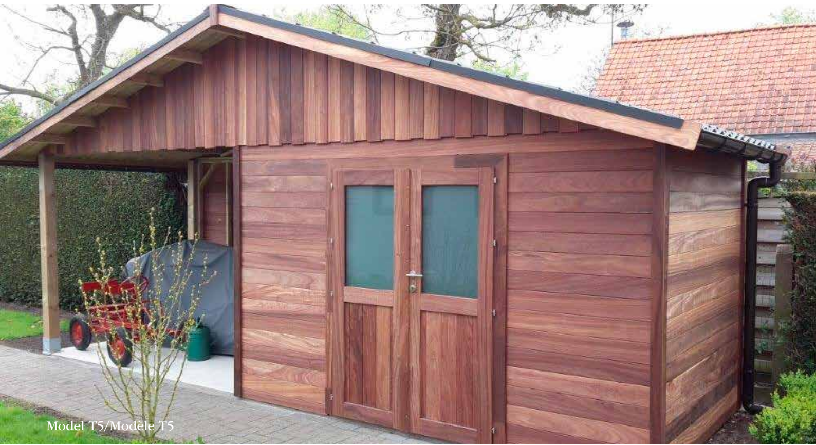
Model T5/Modèle T5