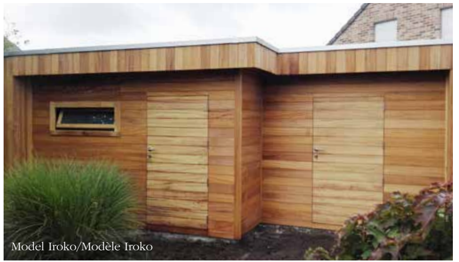
Model Iroko/Modèle Iroko