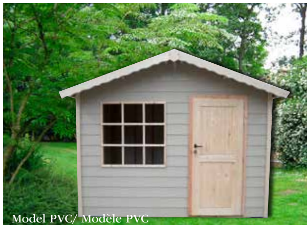
Model PVC/ Modèle PVC