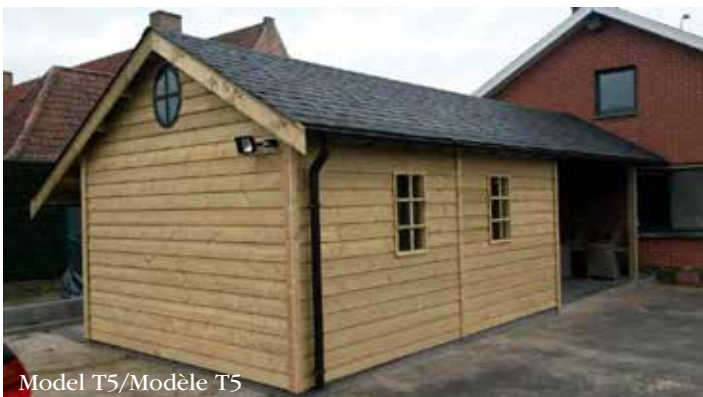
Model T5/Modèle T5