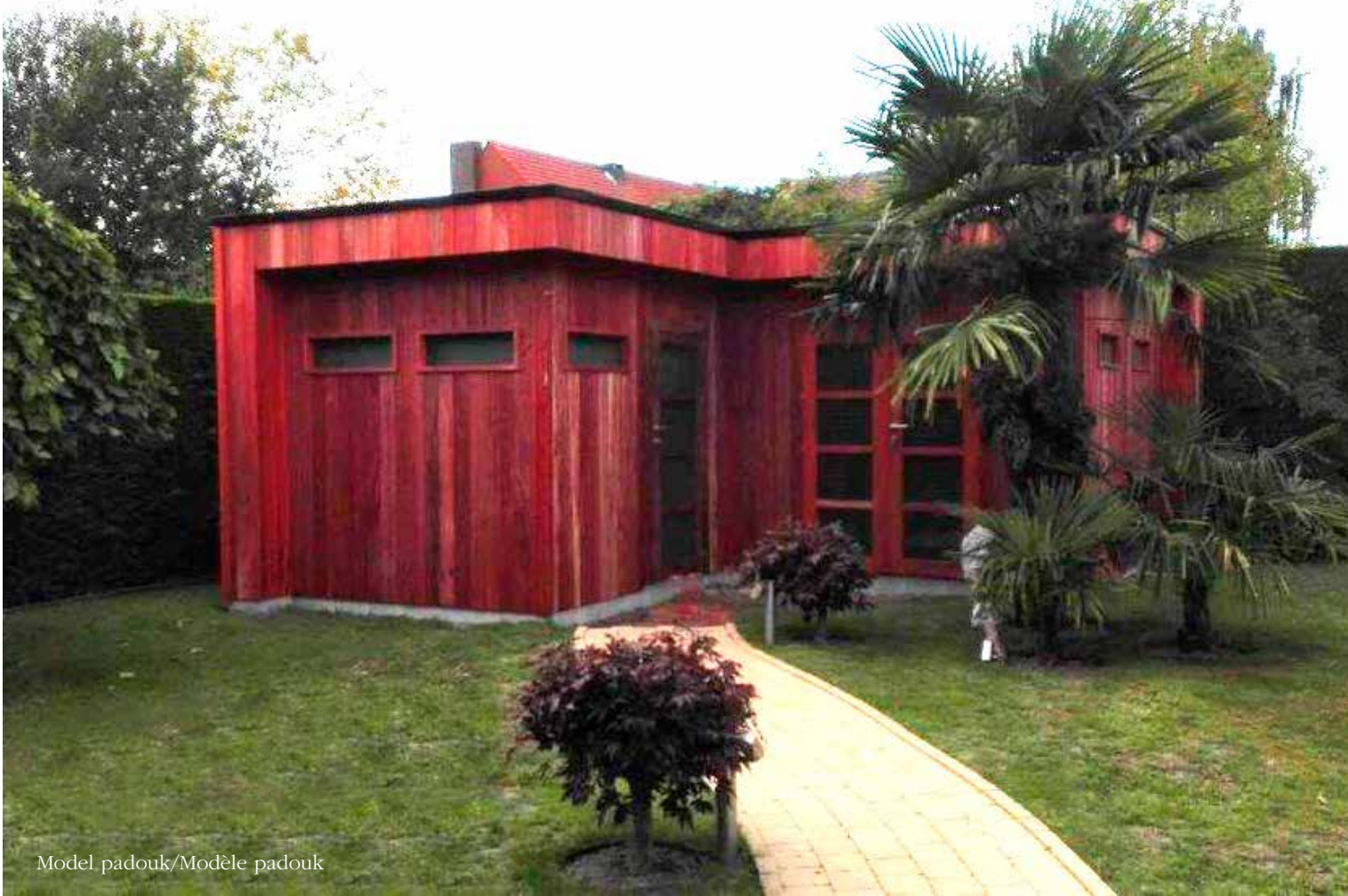
Model padouk/Modèle padouk