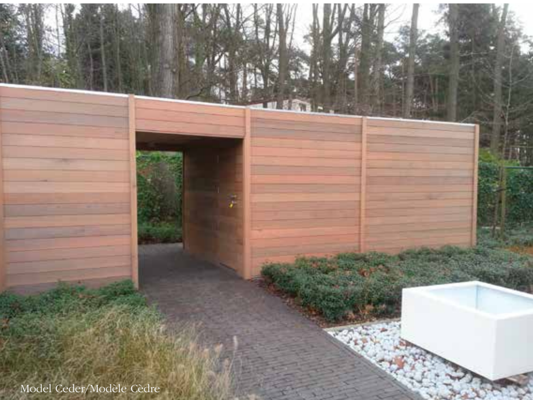
Model Ceder/Modèle Cèdre