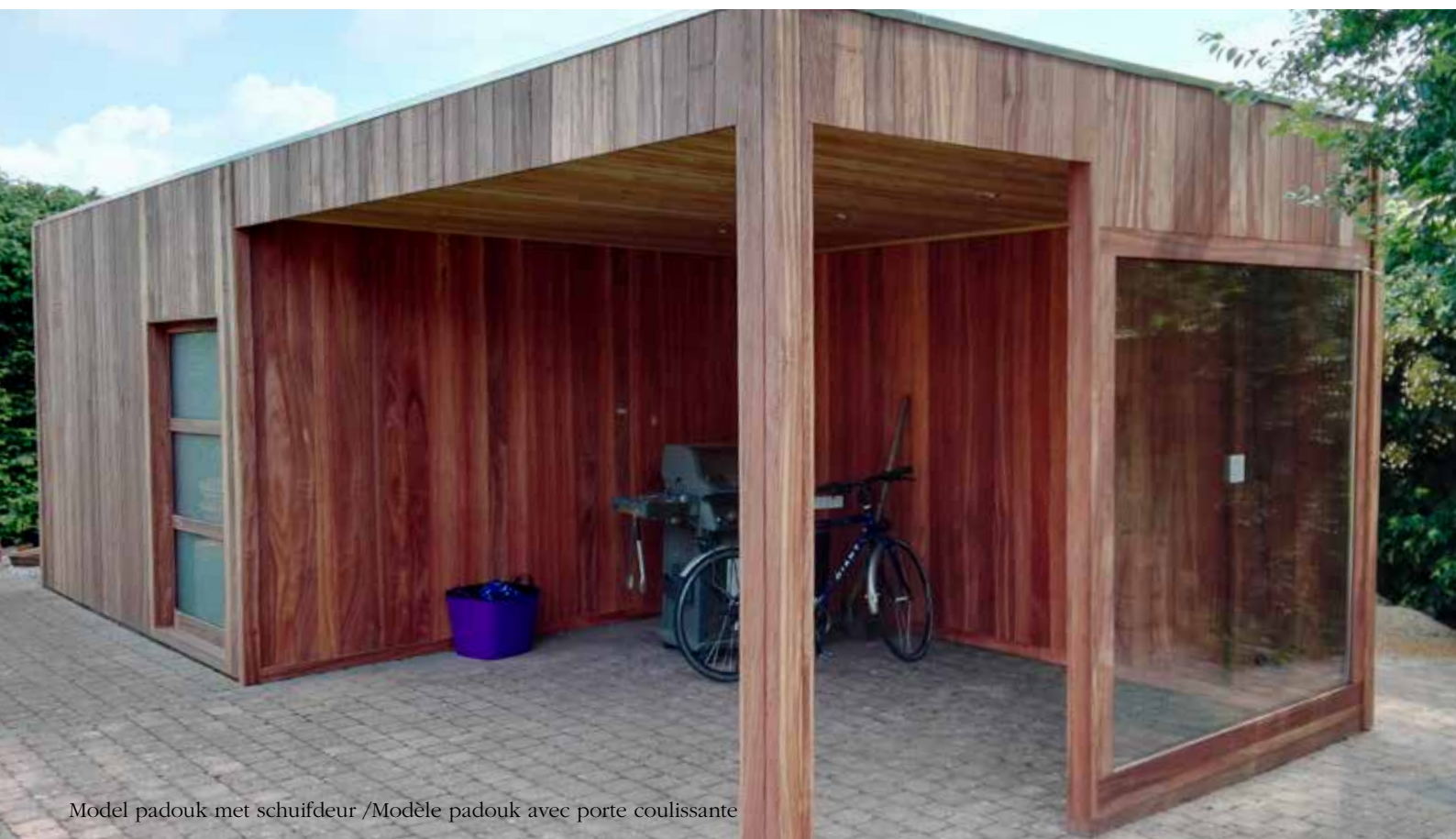
Model padouk met schuifdeur /Modèle padouk avec porte coulissante