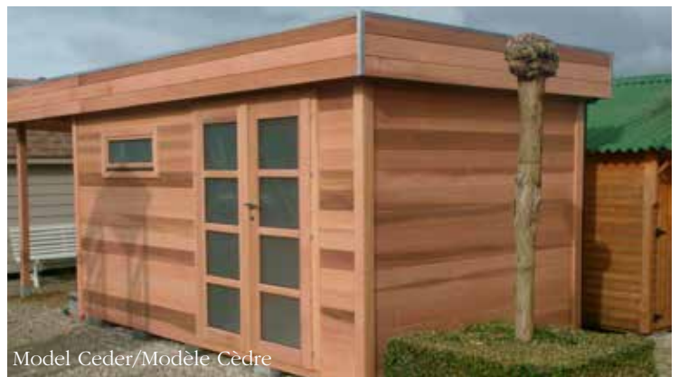
Model Ceder/Modèle Cèdre