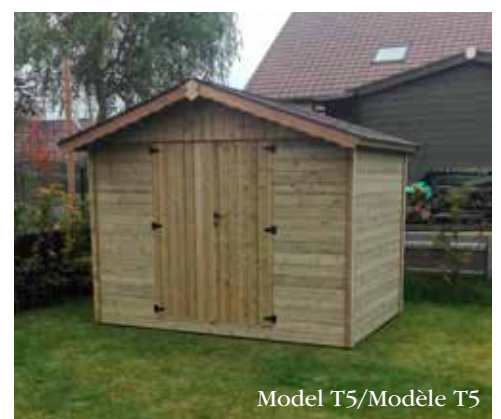
Model T5/Modèle T5