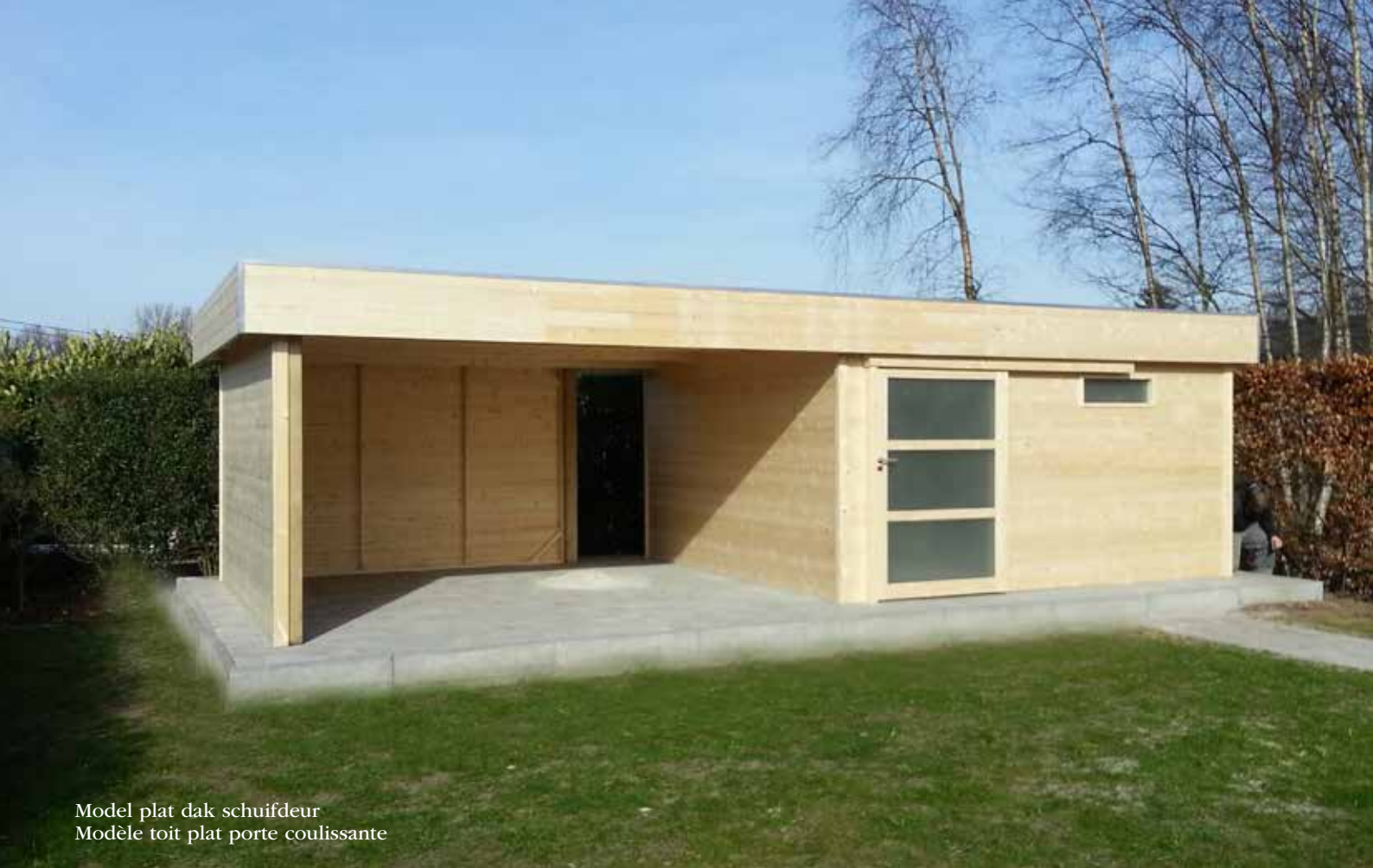
Model plat dak schuifdeur Modèle toit plat porte coulissante