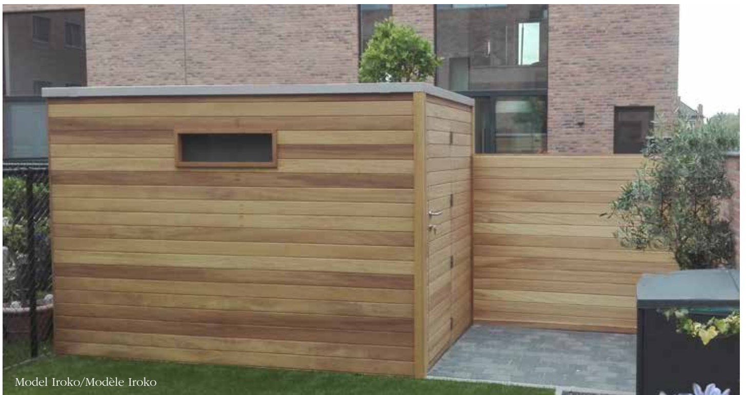
Model Iroko/Modèle Iroko