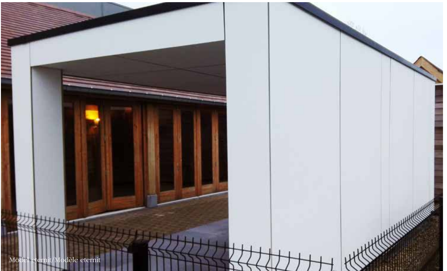
Model eternit/Modèle eternit