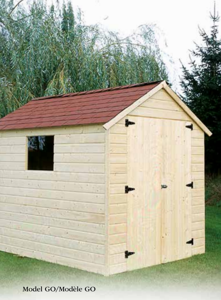
Model GO/Modèle GO