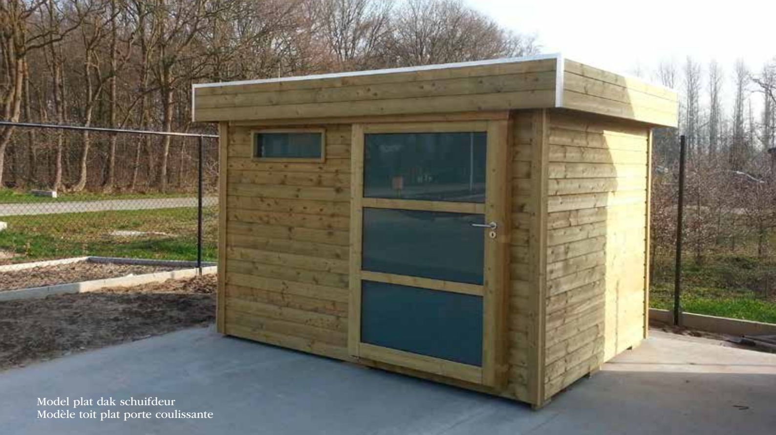
Model plat dak schuifdeur Modèle toit plat porte coulissante