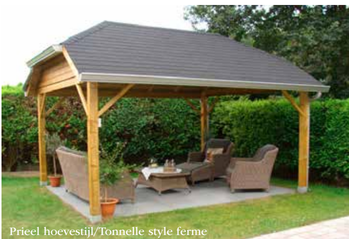
Prieel hoestijl/Tonnelle style ferme