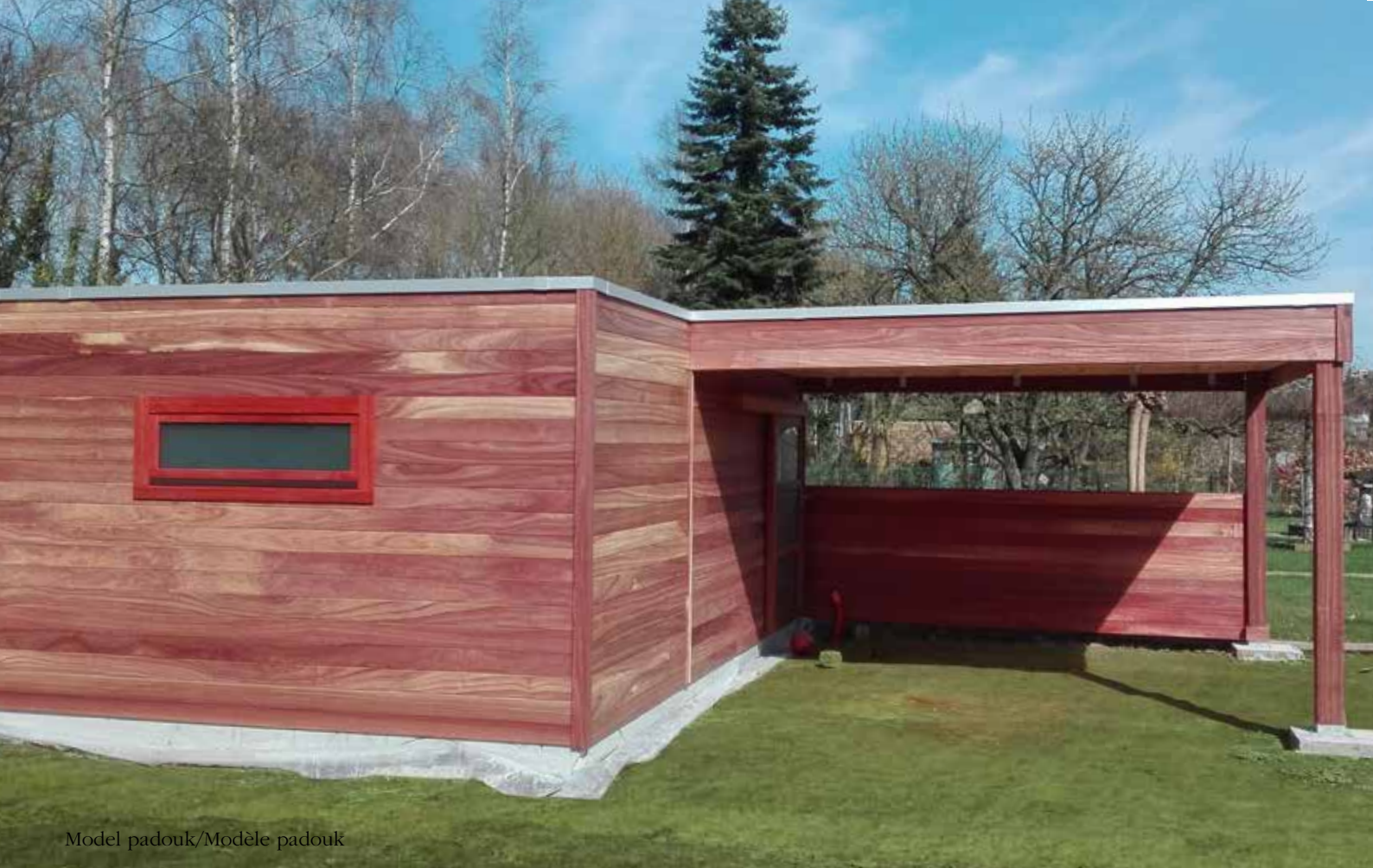
Model padouk/Modèle padouk