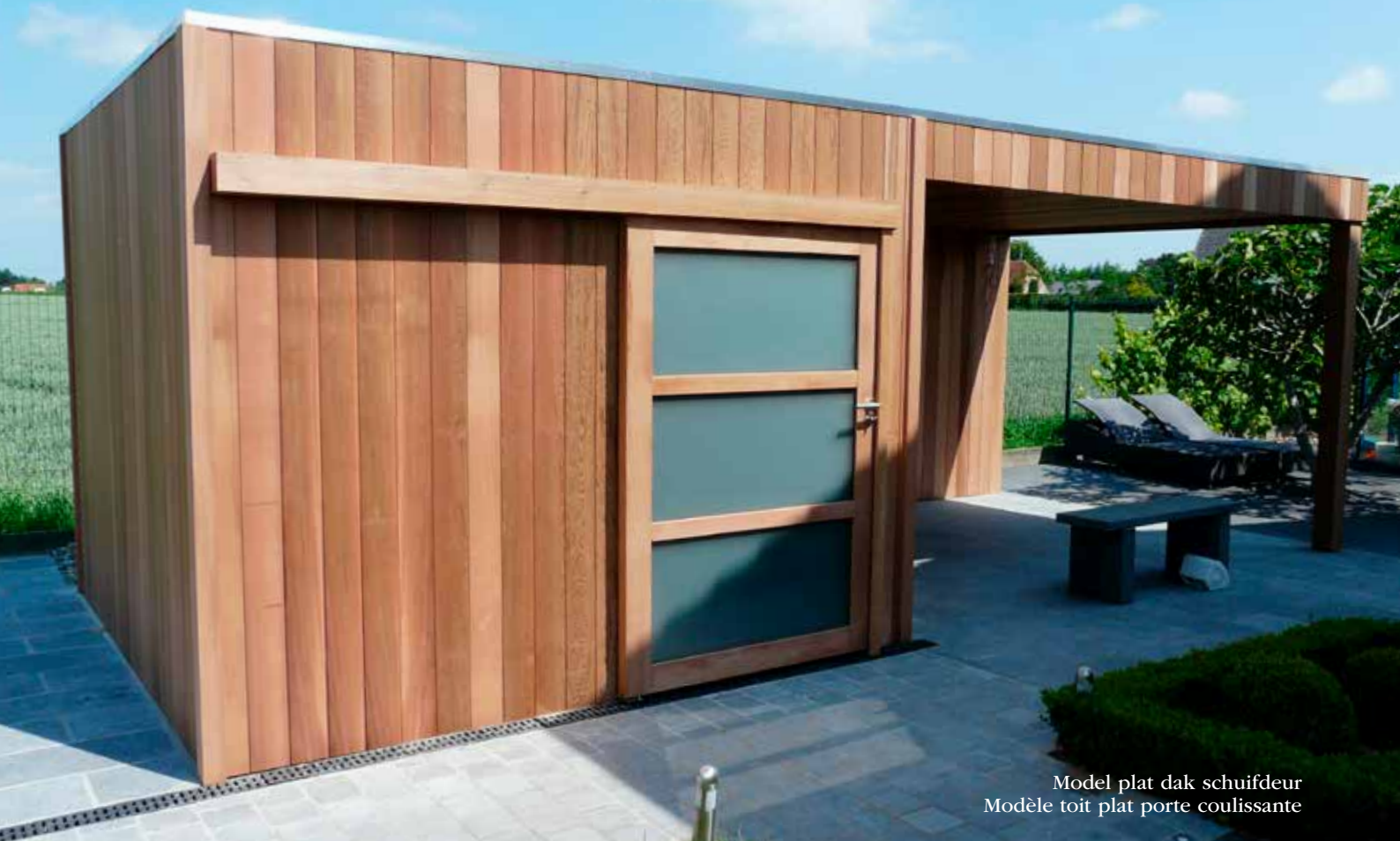
Model plat dak schuifdeur Modèle toit plat porte coulissante