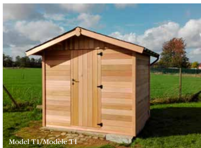
Model T1/Modèle T1