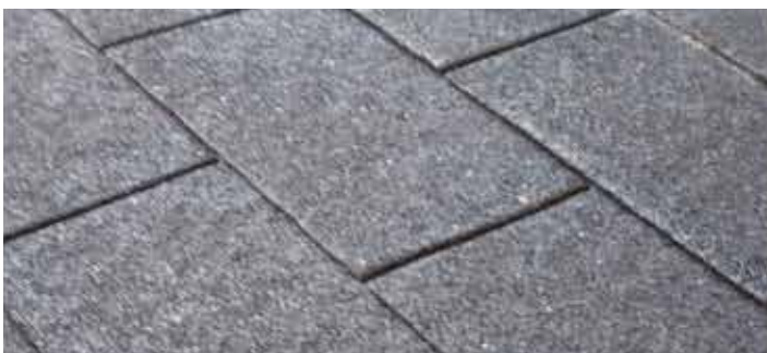
Shingels zwart/ Shingels noir