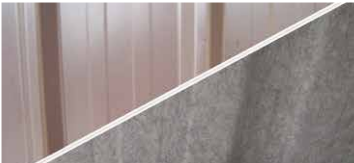
Metaalplaten anti-condens Plaques en métal anti-condensation