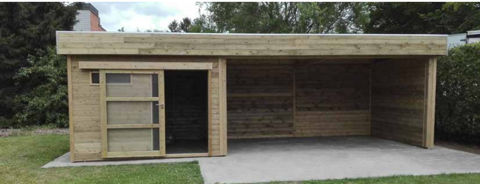
Model Schuifdeur Modèle Porte coulissante