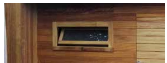
Draai kipraam 25x80cm Fenêtre inclinable 25x80cm