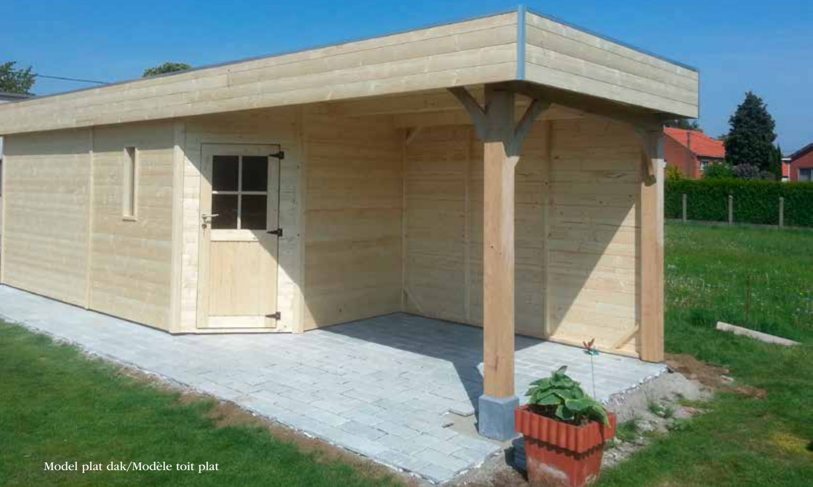
Model plat dak/Modèle toit plat