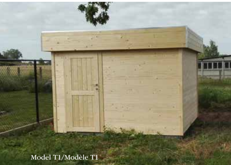
Model T1/Modèle T1