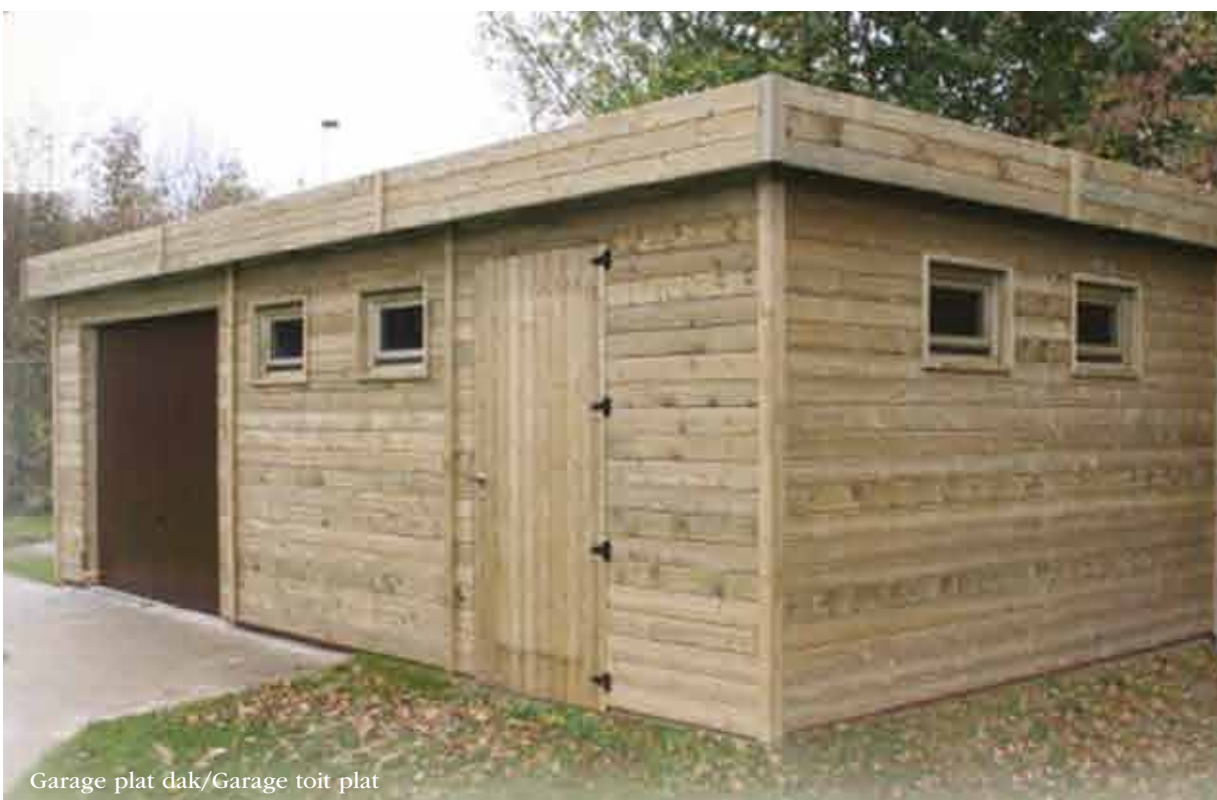
Garage plat dak/Garage toit plat